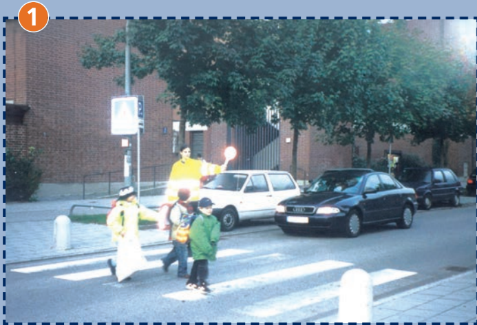
1 Zebrastreifen Fromundstraße