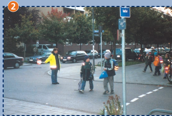
2 Verkehrshelferübergang Otker-/Fromundstraße