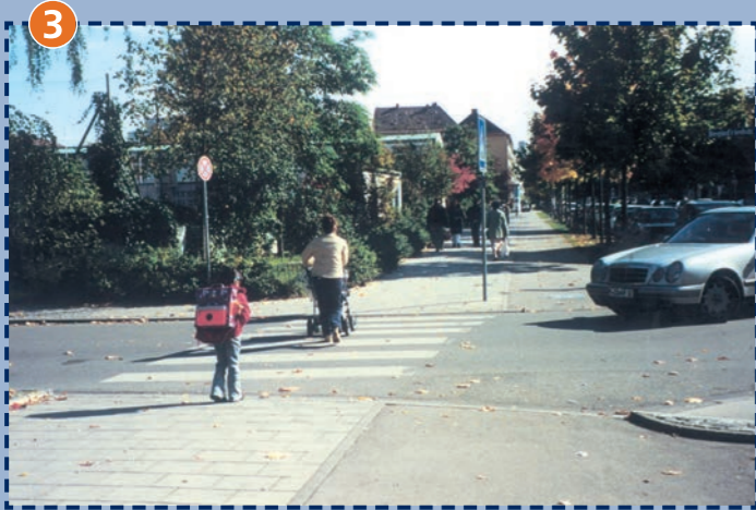
3 Zebrastreifen Reginfried-/Fromundstraße